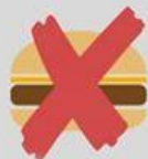
MESO SISAVACA ILI PTICA

Svaki petak u godini, osim ako je u petak svetkovina i na Čistu srijedu (Pepehnica) i Veliki petak.